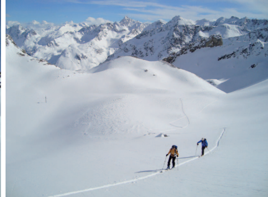
Bild links: Nach der Alp Mulix wird der Blick frei ins Val Tschitta. Bild mitte: Im kleinen Tälchen kurz vor der Furschela da Tschitta. Links der Piz Salteras (auch ein schönes Skitourenziel), rechts der Piz Val Lunga . Bild rechts: Aufstieg über das Val Tschitta.