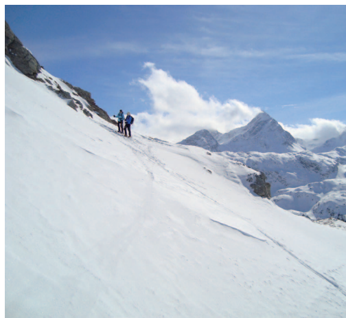
Bild links: Im Aufstieg zur Alp Zvaretta. Im Hintergrund der K2. Rechts: Abfahrtgenuss über die Hänge von Cuziranch, bald lockt das Bier in Preda.

Tipp 2: Nach der Tour auf den Piz Val Lunga kann von Naz auf der Schlittelpiste nach Bergün abgefahren werden, anstatt zurück nach Bergün aufzusteigen.