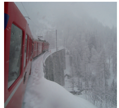
Bild oben: Der Steinbock lebt in Graubünden. Unten links: Dorfkern in Bergün. Mitte: Das Hotel "Weisses Kreuz", ein gute Adresse in Bergün. Rechts: Fahrt nach Preda. Bald beginnt die Schlittelfahrt, oder die Skitour. Auto brauchen wir dazu keines.